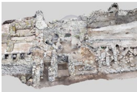
Pompeii, Republican Baths, 3D Model

advanced bathing culture and consequently generated more standardized spaces for bathing. Both developments, ultimately, were highly dependent on the technical development of water supply patterns.