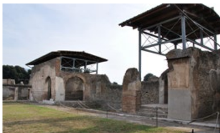
Pompeii, Stabian Baths, Natatio

By juxtaposing the results of new research at key urban centers and bathing complexes, the conference aims to trace these parallel developments and to show that they were interrelated: more complex cityscapes necessitated a more