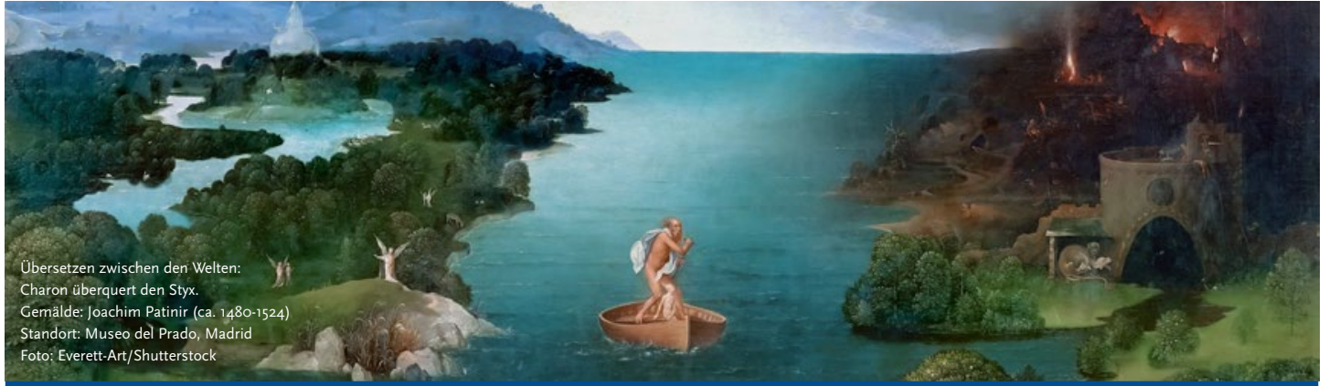
Übersetzen zwischen den Welten: Charon überquert den Styx. Gemälde: Joachim Patinir (ca. 1480-1524) Standort: Museo del Prado, Madrid

Topoi-Kicktipp-Runde zur EM 2016 eröffnet